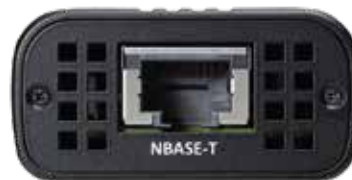
NBASE-Tイーサネットポートの外観